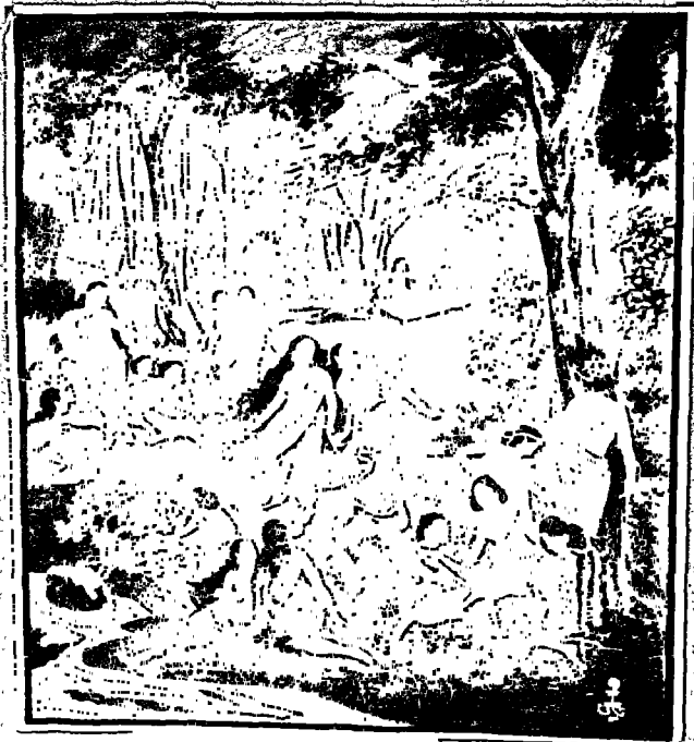
एव पूर्वस्यदीक्षति विक्रान्तानि रतायि च । एवमे कथयिष्या नी रमाते कृष्णपाण्डवे ॥